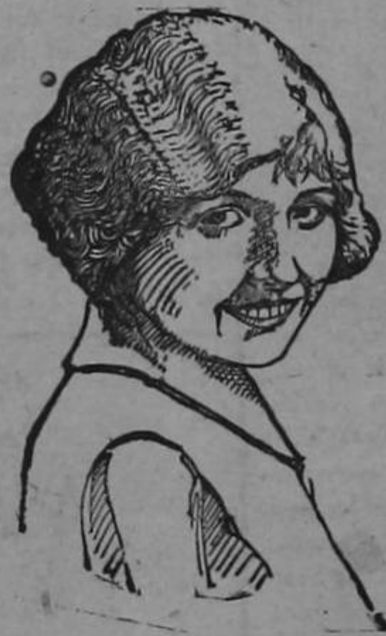
La Estrella del Cine: Señorita EVA NOVAK Dice: Desde que empecé a usar la PASTA DENTIFICA

Consignamos estas líneas por su importancia y porque siempre acogemos gustosos toda manifestación del caballero amigo señor Gutiérrez.